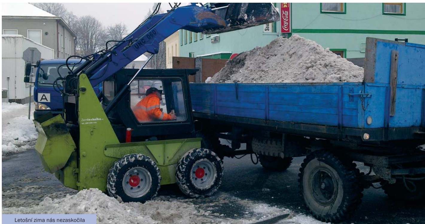
Letošní zima nás nezaskočila

Od listopadu loňského roku jsme naplno zajišťovali zimní údržbu pro město Štětí. Plynule jsme tak navázali na letní čištění a poskytování ostatních služeb v rámci této zakázky. Hned naše první zima ve Štětí důkladně prověřila nejen organizační schopnosti pracovníků, ale také technické možnosti používaných strojů. Pro zajímavost dodáme, že zakázka zahrnuje i dalších 9 spádových obcí.