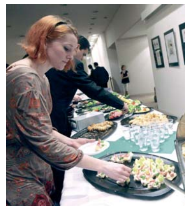
Nejlepší pochvalou je když ubývá...