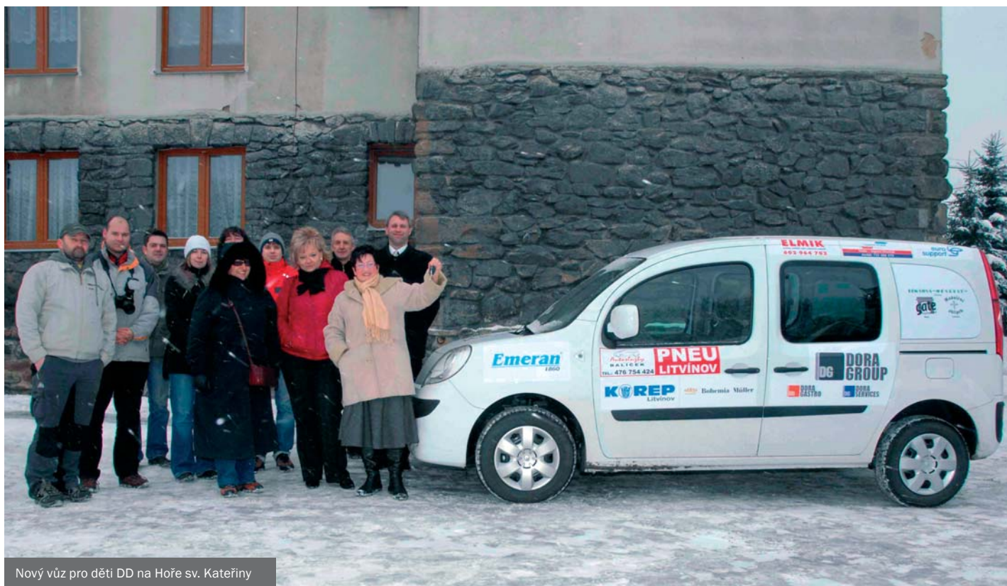
Nový vůz pro děti DD na Hoře sv. Kateřiny

Je již jakousi tradicí, že se skupina DORA v rámci svých dobročinných aktivit podílí na projektu „Sociální automobil“. Již šestým rokem pomáhá společně s dalšími regionálními firmami obnovovat vozové parky v ústavech a zařízeních, která svoji činnost zaměřují na výchovu, vzdělávání, rehabilitaci a integraci zdravotně či mentálně postižených dětí a mládeže.