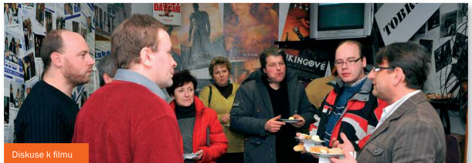
Diskuse k filmu